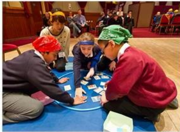
完成したかるたは、学校や地域で使用