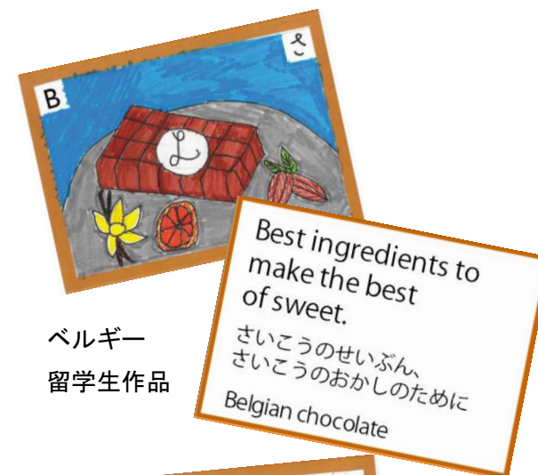
ベルギー 留学生作品