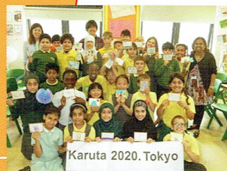
Karuta 2020, Tokyo