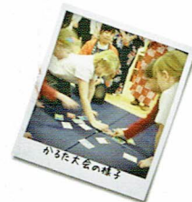
かるたを遊ぶ様子

この1年間に創作されたかるたや海外から応募された400点以上の中から受賞作品を発表・表彰します。