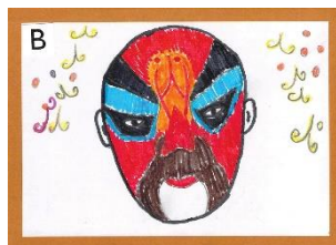
「京劇」中国人留学生作 (専修大)